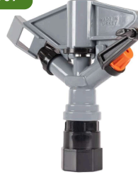
Cansu Dişi Spring Gri Cansu