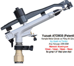
Yuzuak ATOM35 (Patentli) Kısmi Metal Gövde ve Ping A2 Gövde Ağı: 30kg ve üzeri Ağız Yarıçapı: 200-350mm Mantol: Alüminyum 12mm - 14mm - 16mm - 18mm Bağlantı: 1,5" Dişli İçten Dışı