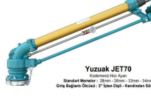
Yuzuak JET70 Kendinden Sökülebilen Standart Mantol: 28mm - 30mm - 32mm - 34mm Giriş Bağlantı Ölçüsü: 3" İçten Dışı - Kendinden Sökülebilen