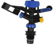
Karbir Mini Spring Karbir M-16