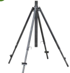
4 Ayak Pro Eko 2" Söktaklı Bağlantı Sehpaı Profesyonel Ayarlanabilir ağız Sehpa Modelidir. 75mm Mancalı Bağlantı Motopumpu Fiya Dahildir. Atom40, Ducar90, Atom42 Modeli ile uyumludur.

4 Ayaklı Pro Eko Söktaklı Bağlantı Sehpaı