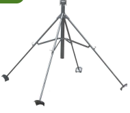
4 Ayaklı Eko 2.5" - Bağlantı Sehpa'sı 25" Yüksekliğinde Bağlantı - 75mm Mandallı Bağlantı Mükemmelleştirme Fiyatına Dahildir.