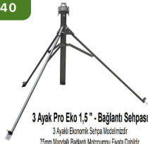
3 Ayak Pro Eko 1,5" - Bağlantı Sehpaı 3 Ayaklı Ekonomik Sehpa Modelidir. 75mm Mancalı Bağlantı Motopumpu Fiya Dahildir. Atom35 EKO Modeli ile uyumludur.