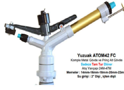
Yuzuak ATOM42 Fc Kısmi Metal Gövde ve Ping A2 Gövde Bağlantı: 2" Dişli İçten Dışı Ağız Yarıçapı: 200-350mm Mantol: Alüminyum - 16mm - 18mm - 20mm - 22mm Bağlantı: 2" Dişli İçten Dışı