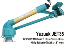
Yuzuak JET35 Standart Mantol: 10mm - 12mm - 14mm - 16mm - 18mm Giriş Bağlantı Ölçüsü: 1,5" İçten Dışı