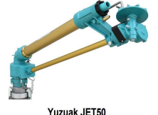
Yuzuak JET50 Standart Mantol: 14mm - 16mm - 18mm - 20mm - 22mm - 24mm Giriş Bağlantı Ölçüsü: 2" İçten Dışı