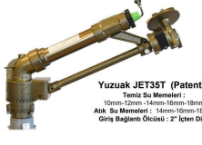
Yuzuak JET35T (Patentli) Tandem Süz Mantolü: 10mm - 12mm - 14mm - 16mm - 18mm Ağız Süz Mantolü: 14mm - 16mm - 18mm Giriş Bağlantı Ölçüsü: 2" İçten Dışı