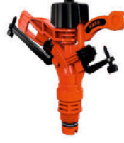
Karbir Pars Spring