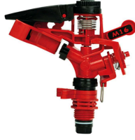
Karbir Mini Açılı Spring Karbir M-16