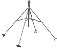
4 Ayaklı Eko 3" - Bağlantı Sehpa'sı 30" Yüksekliğinde Bağlantı - 80mm veya 110mm Mandallı Bağlantı Mükemmelleştirme Fiyatına Dahildir.