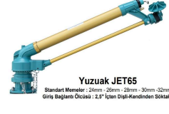
Yuzuak JET65 Standart Mantol: 24mm - 26mm - 28mm - 30mm - 32mm Giriş Bağlantı Ölçüsü: 2,5" İçten Dışı - Kendinden Sökülebilen