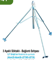
3 Ayaklı Söktaklı - Bağlantı Sehpaı 1,5" Giriş Her Modelde ile uyumludur. (Atom35, Atom35S, EJET35, EJET35S) Her Çıkartılabilir ve Kaliteli Modeldir. 75mm Mancalı Bağlantı Motopumpu Fiya Dahildir.