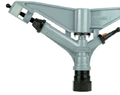
Karbir G-30 Maxi