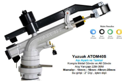
Yuzuak ATOM40 S Kısmi Metal Gövde ve Ping A2 Gövde Ağı: 30kg ve üzeri Ağız Yarıçapı: 200-350mm Mantol: Alüminyum - 16mm - 18mm - 20mm Bağlantı: 2" Dişli İçten Dışı