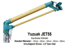
Yuzuak JET55 Kendinden Sökülebilen Standart Mantol: 20mm - 22mm - 24mm - 26mm - 28mm Giriş Bağlantı Ölçüsü: 2,5" İçten Dışı