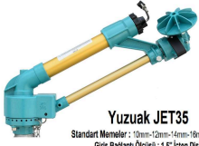
Yuzuak JET35 Standart Mantol: 10mm - 12mm - 14mm - 16mm - 18mm Giriş Bağlantı Ölçüsü: 1,5" İçten Dışı