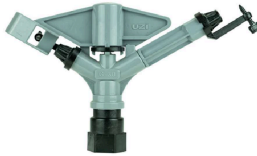
Karbir G-30X Uzi