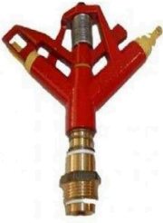
Dikatar Metal Spring