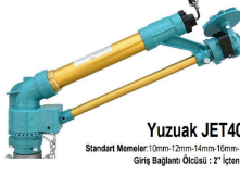
Yuzuak JET40 Standart Mantol: 10mm - 12mm - 14mm - 16mm - 18mm - 20mm - 22mm Giriş Bağlantı Ölçüsü: 2" İçten Dışı