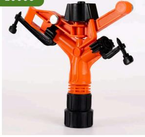
Erkek Spring Rain